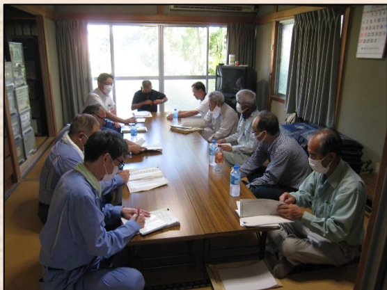
▲砂防ボランティアとの意見交換会