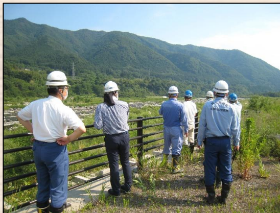
とこがためぐん 花輪床固群