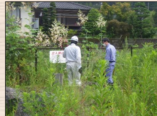
注意看板の設置状況を確認