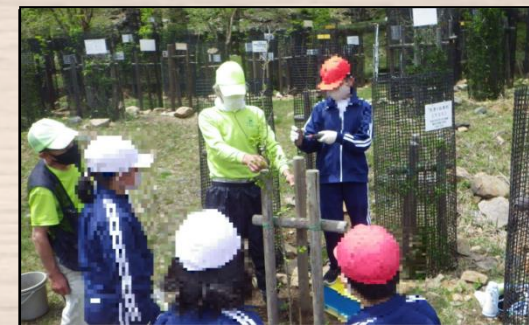
植樹された苗木の成長により、山肌を強くします。