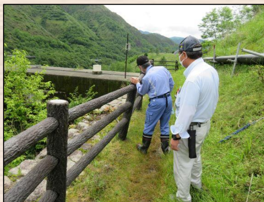
転落防止柵の状態を確認

なお、点検を行っていますが、利用にあたっては、自己責任による安全確保をお願いします。