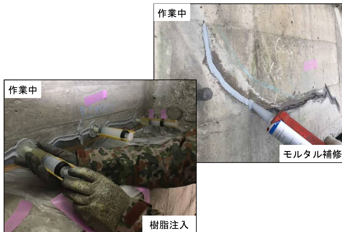
ひび割れ補修の状況