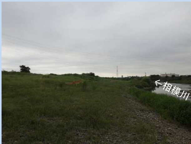
工事着手前 (令和4年8月)