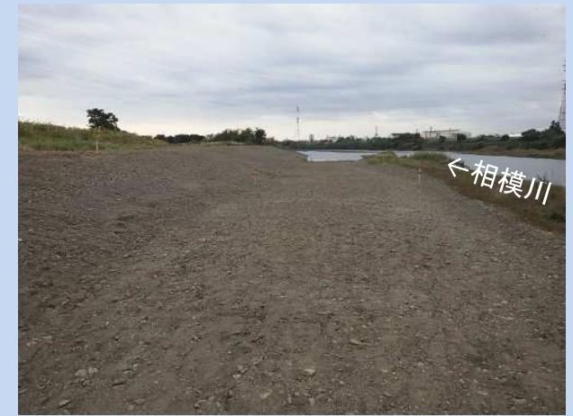
河道の掘削が完了しました。 (令和4年10月)