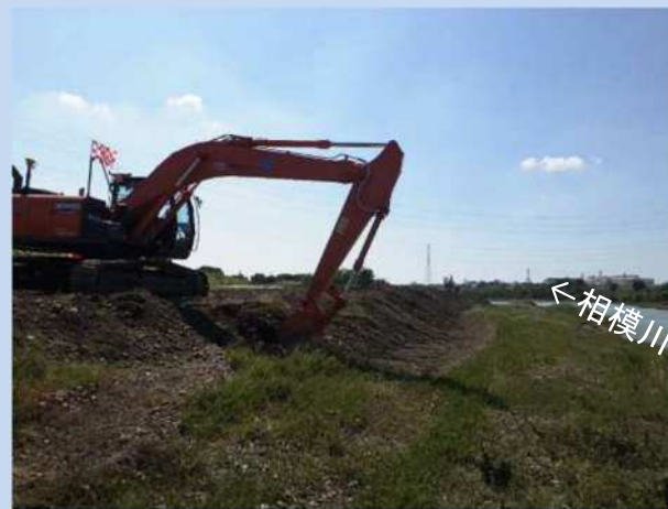
河道を掘削しています。 (令和4年9月)