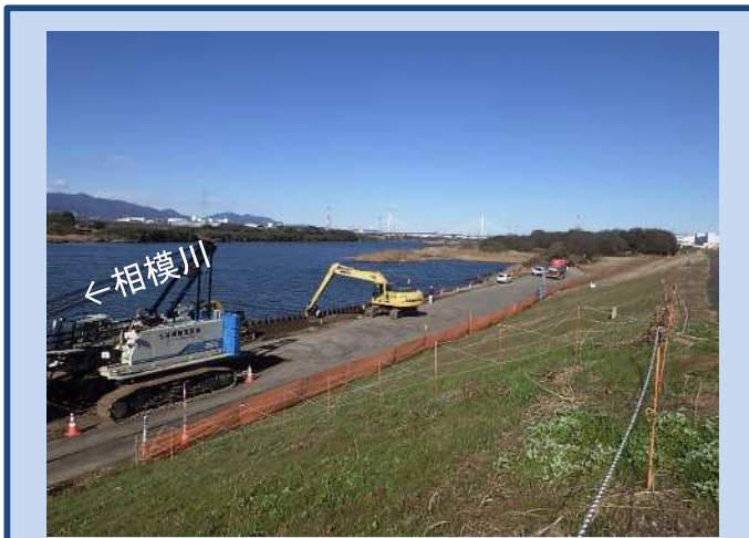
護岸を施工しています。 (令和4年12月)