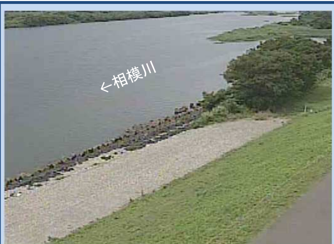
工事着手前 (令和4年6月)