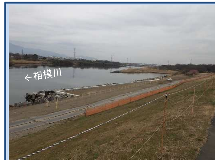
完成了ました。 (令和5年3月)