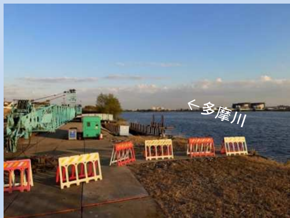
工事に入る準備をしています。 (令和4年10月)