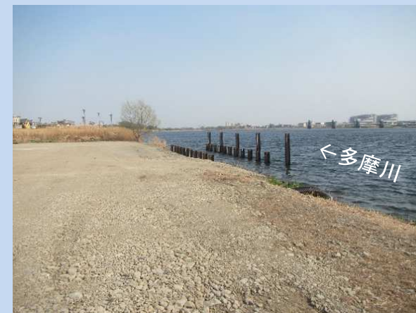
完成了ました。 (令和5年3月)