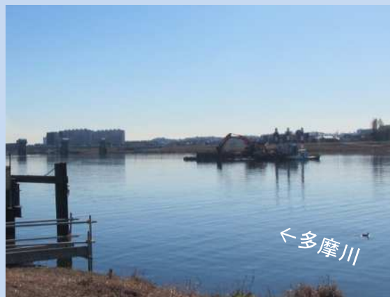
河道内を掘削しています。 (令和4年12月)