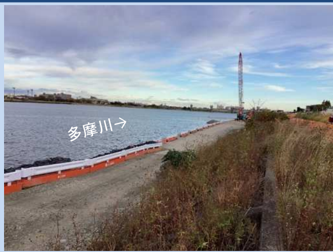
工事に入る準備をしています。 (令和4年10月)