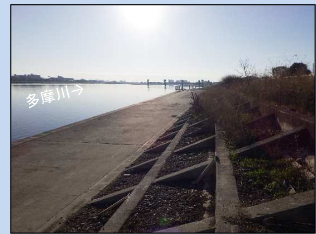
完成了ました。 (令和5年3月)