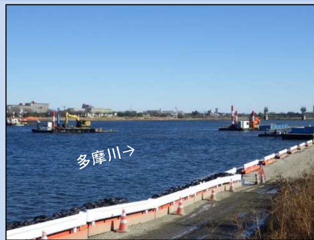
河道を掘削しています。 (令和4年12月)