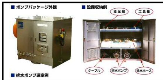
排水ポンプパッケージ (10m 3 /min)