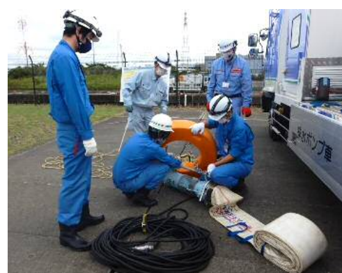
排水ポンプ車 排水ポンプ組立