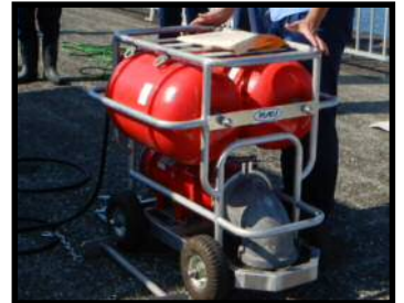
小型移動式排水設備 (2.5m 3 /min)