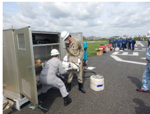
移動式排水設備 排水ポンプ組立