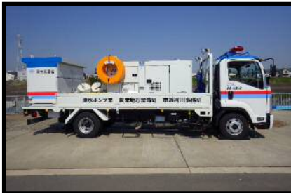
排水ポンプ車 (30m 3 /min)