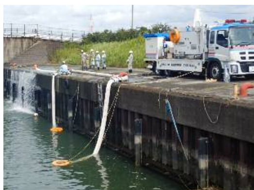
排水ポンプ車 実排水状況