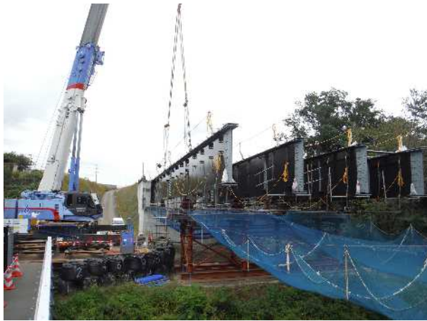
桁架設の施工状況