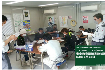
安全教育訓練状況