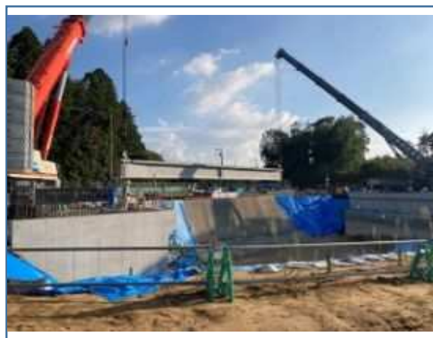
PC桁架設施工状況(両宿地区)