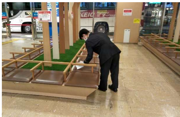
待合室ベンチの消毒