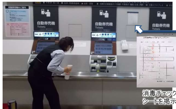
自動発券機の消毒