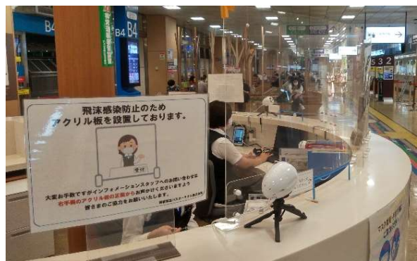
アクリルパネルの設置(インフォメーション)