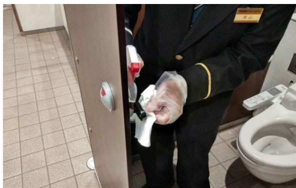
トイレドアノブの消毒