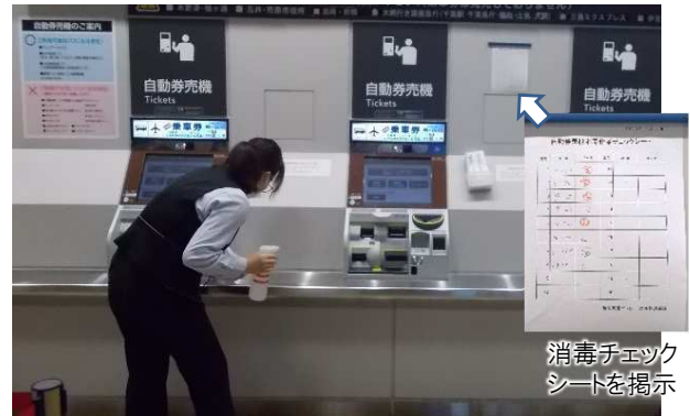
自動発券機の消毒