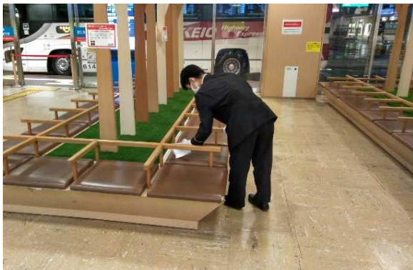
待合室ベンチの消毒