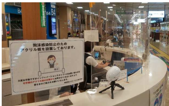
アクリルパネルの設置(インフォメーション)