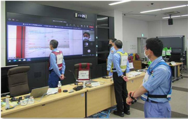
常陸太田市とのWEBによる ホットライン訓練