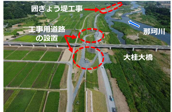
囲ぎよう堤 工事の状況

○今回は、前回に引き続いて囲ぎよう堤や工事用道路の工事の進捗をご紹介します。大桂大橋の下流側には橋から堤防に直接下りられるよう工事用の坂路が開通していますが、上流側も工事を進めています。下流側を現場への入口、上流側を出口として使用する予定です。