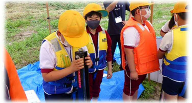
川の透明度の測定