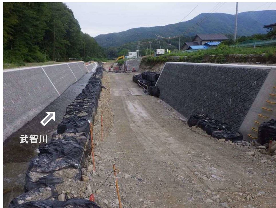
上流より施工箇所を望む（流路護岸工）

武智川下流床固群のうち、床固工、帯工、護岸及び人道橋を施工し、土砂・洪水を安全に流下させ、土砂災害を防止する。現在、右岸側の流路護岸工を実施中。