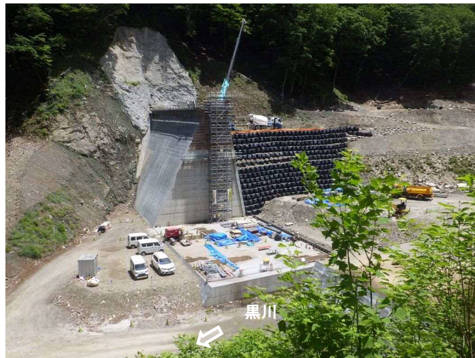
下流 左岸上部より本堰堤を望む（コンクリート堰堤工）

釜無川右支黒川において、土砂流出に伴う下流域での土砂・洪水氾濫の被害を防止・軽減するため、砂防堰堤を施工する工事。現在、コンクリート堰堤工を実施中。