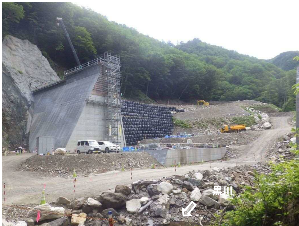
下流より本堰堤を望む（コンクリート堰堤工）