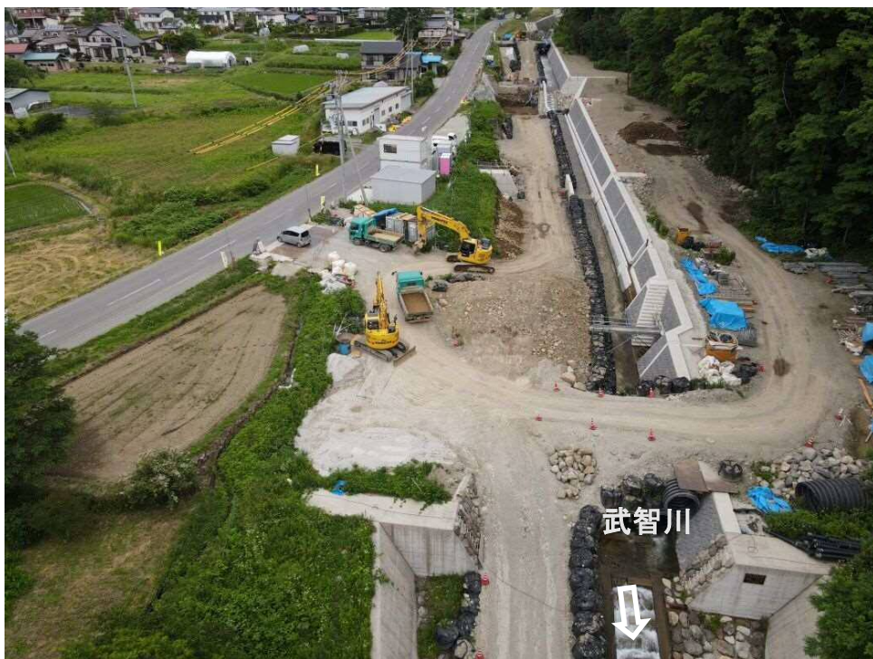
下流上空より施工箇所（全景）を望む