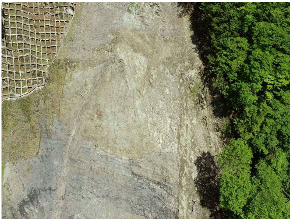
【着手前】上空より施工箇所を望む