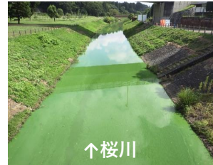
試験開始から4時間後

※霞ヶ浦導水事業が完成するまでの間、試験的に通水を行うもので、水質浄化効果は（希釈効果）は一時的なものとなります。