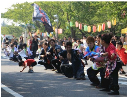
まいあみストリート (よさこい、大道芸など)