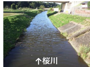
過去の試験時の様子