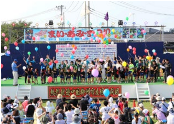
メインステージ (ダンス、芸能ショーなど)

町在住・在勤・在学者の有志で組織される実行委員会により企画運営されており、3年ぶりの開催に向けて感染症対策を講じた催しが検討されています。