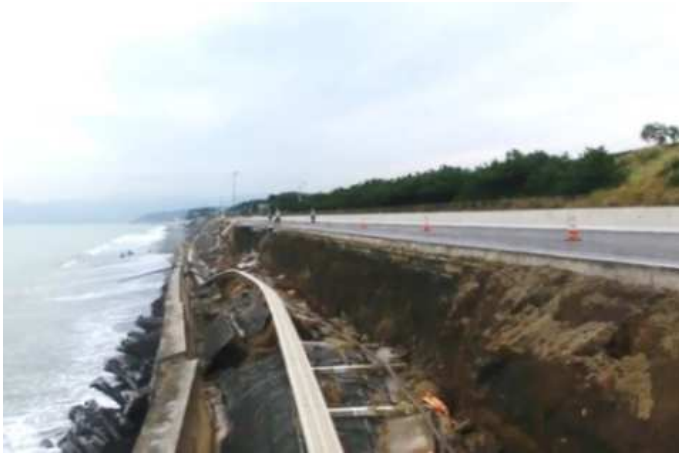
護岸及び道路崩落状況