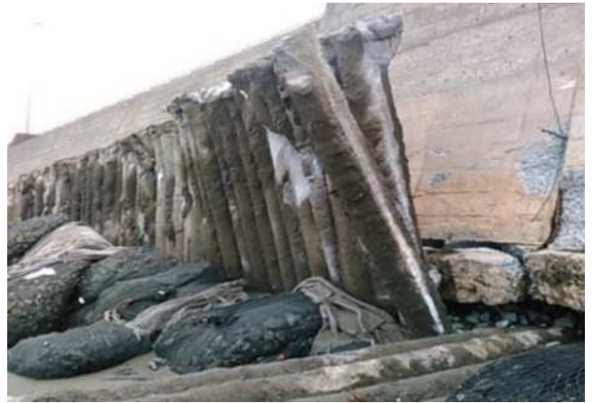
護岸擁壁洗掘状況