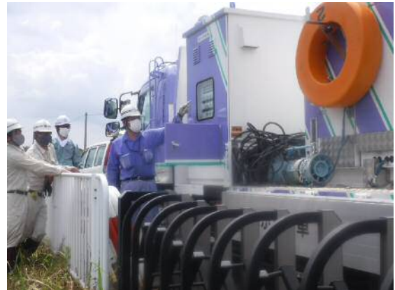
排水ポンプ車 排水ポンプ運転方法確認