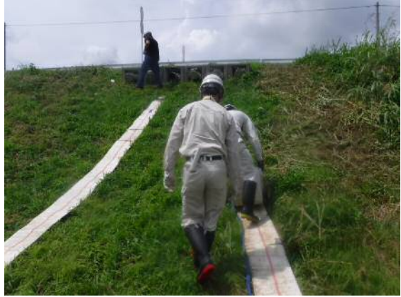
川裏側排水ホース敷設