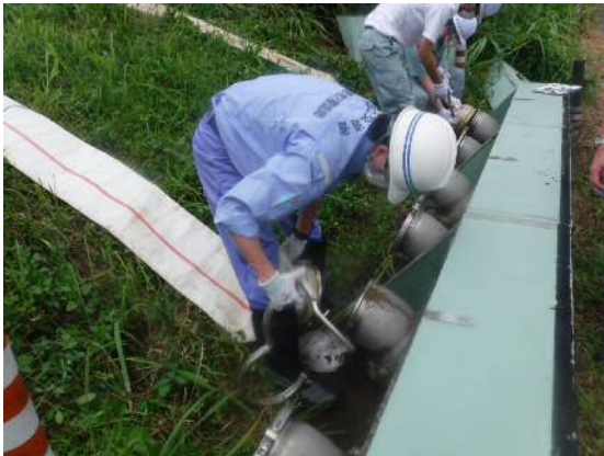
川表側排水ホース敷設