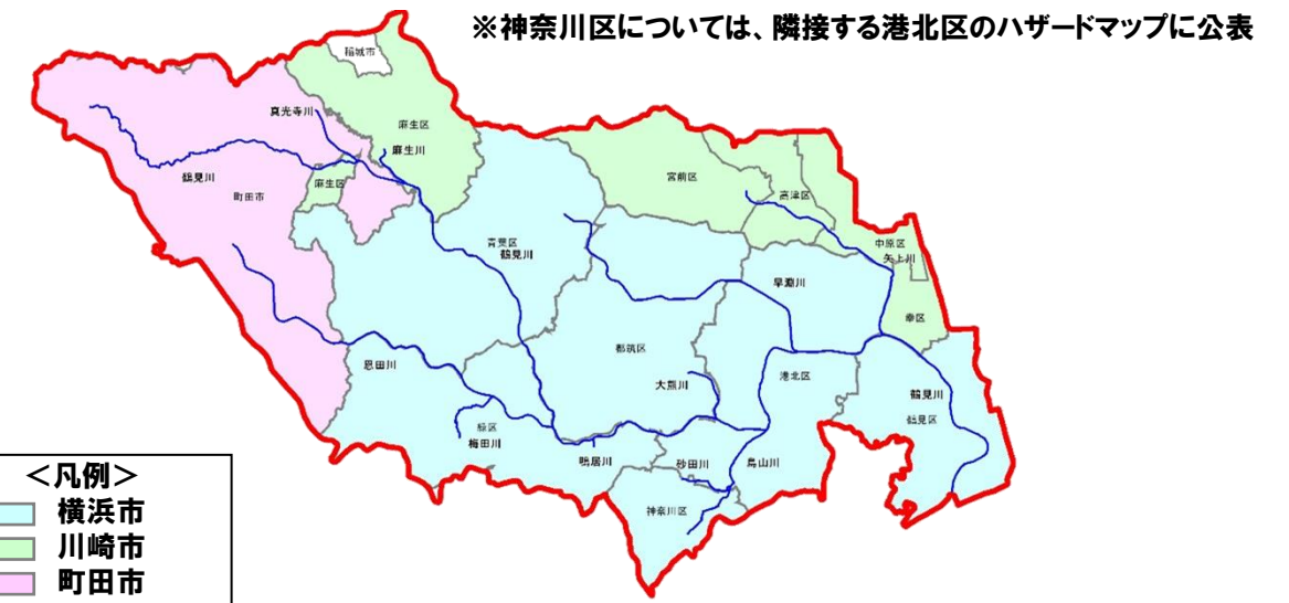
図 ハザードマップ公表状況