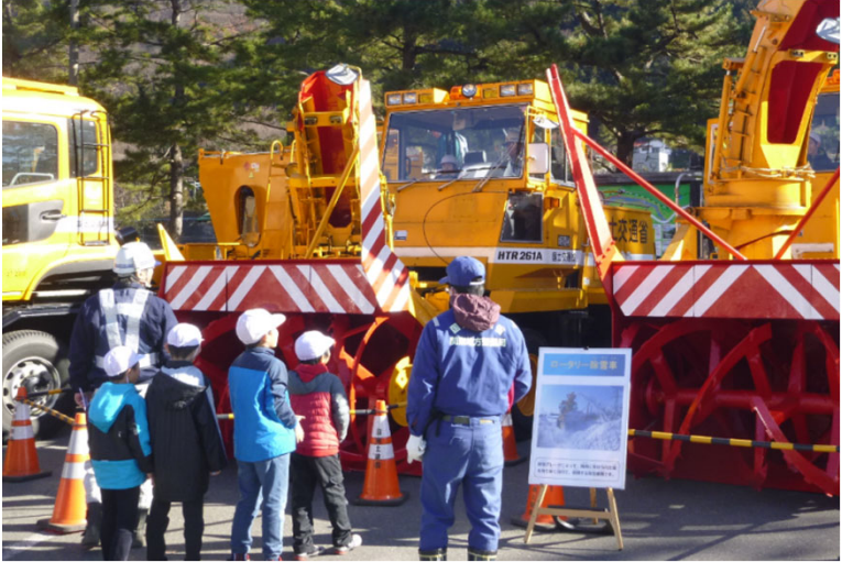
除雪機械乗車・操作体験