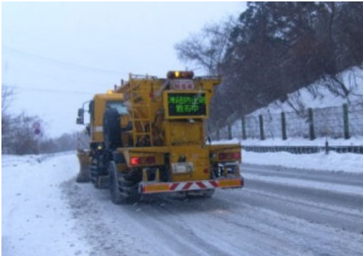
凍結防止剤散布車

凍結防止剤を散布し、路面の凍結を防ぐ目的で使用する除雪機械です。冬期における走行車両の安全性を向上させます。