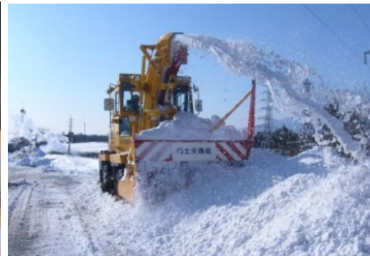
ロータリー除雪車

雪を路肩にかき寄せ、車道を確認する目的で使用する除雪機械です。この車両を主力として除雪作業を行います。