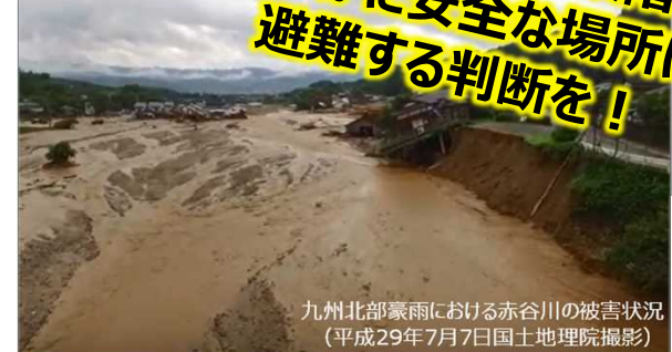
九州北部豪雨における赤谷川の被害状況 (平成29年7月7日)