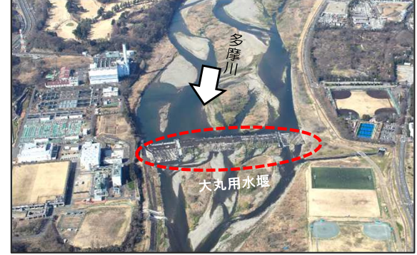
現在の大丸用水堰