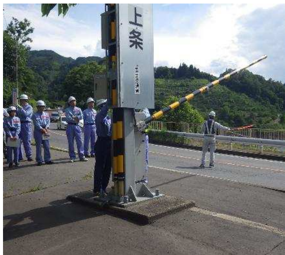
片側交互通行規制実施状況