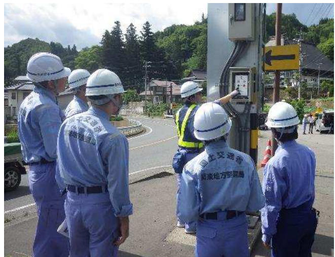
職員が大雨災害に備え 遮断機の操作方法を確認