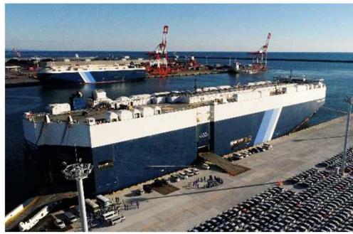
茨城港常陸那珂港区中央ふ頭