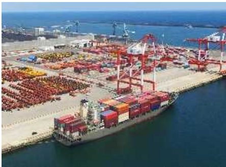
茨城港常陸那珂港区北ふ頭

申込み用紙に必要事項を記入の上、 6月2日まで にお申込み下さい。(先着順となります。)