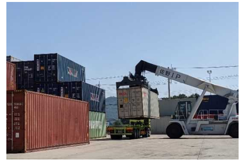
佐野インランドポート