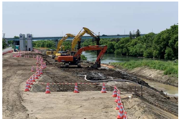
地盤改良工事 (建設機械の足場確保のための改良)