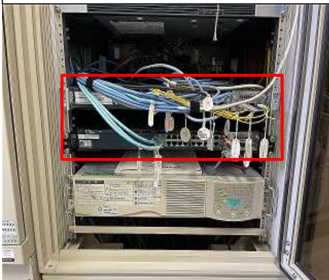
ネットワーク設備設置状況 (北千葉導水路管理支所)