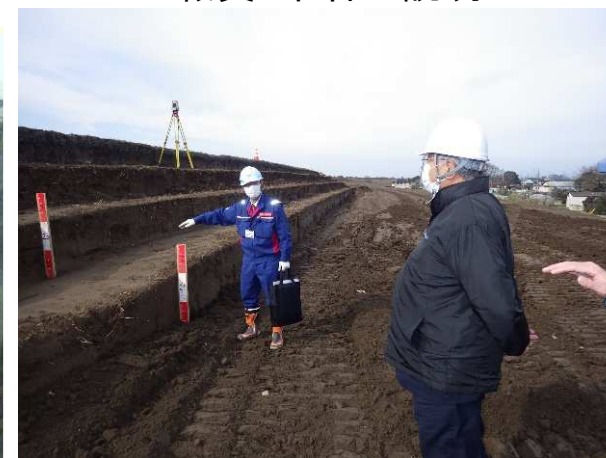
ICT施工の様子を職員が説明