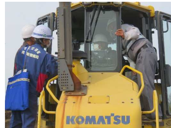
ICT建設機械のモニター等を職員・業者が説明