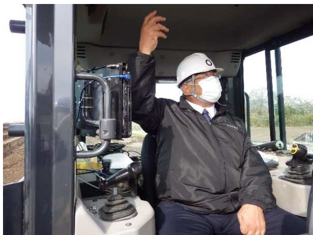
ICT建設機械に乗車された町長