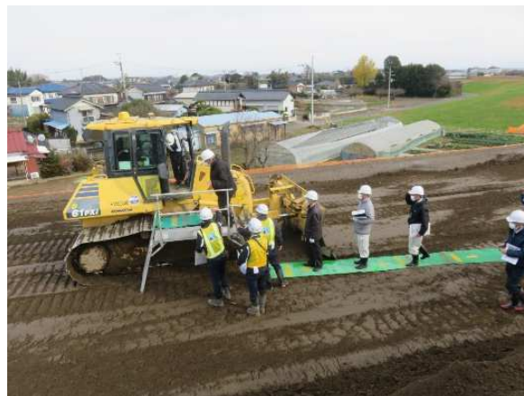
ICT建設機械に乗り込み