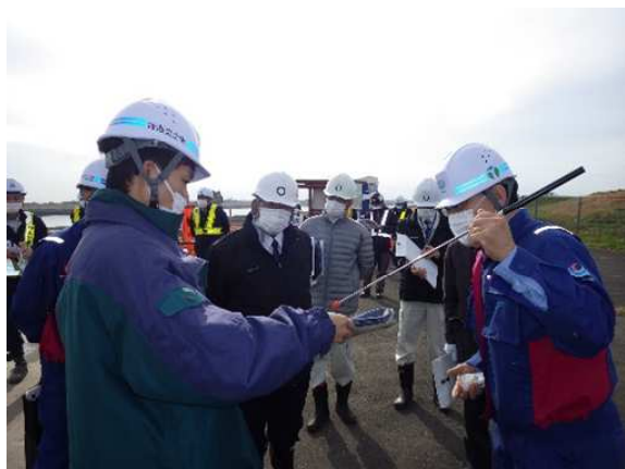
築堤の様子を職員が説明