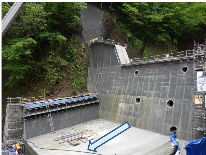
左岸側から右岸を望む