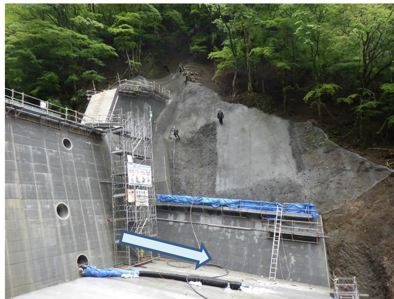
右岸側から左岸を望む

池の沢砂防堰堤群のうち最上流の砂防堰堤で、土砂・洪水を安全に流下させ土砂災害を防止する工事を行っています。