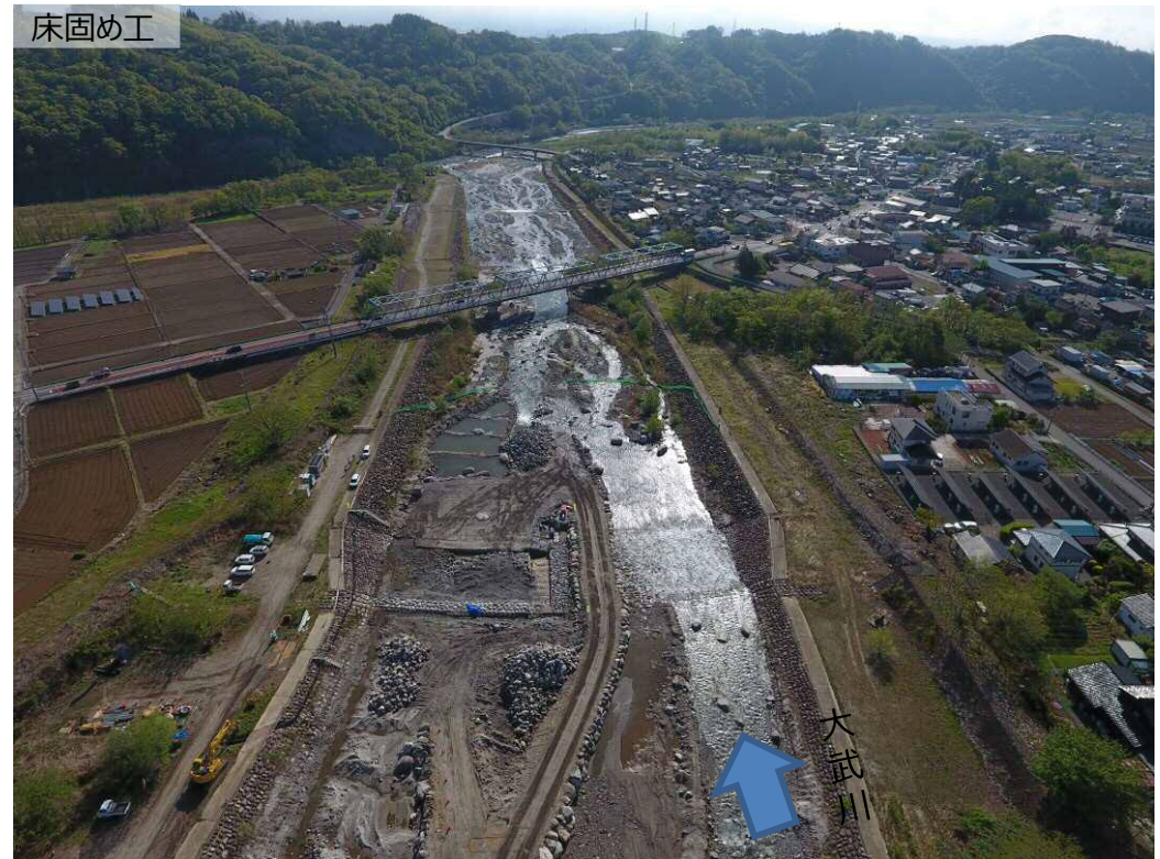
上流側より下流全景撮影

大武川第47床固において、洪水により流出した根固めブロックの再設置、摩耗した魚道等の改築を施工しています。