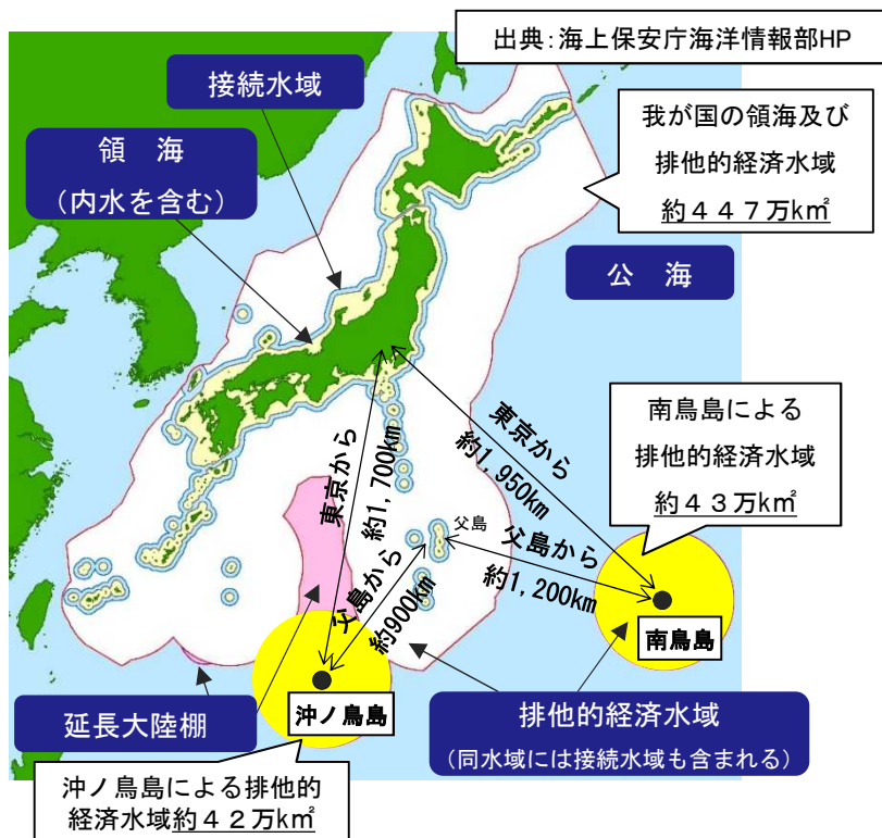
【南鳥島及び沖ノ鳥島の位置】

○活動拠点がができることで、本土から遠く離れた海域においても調査船等の効率的な運航が図られます。