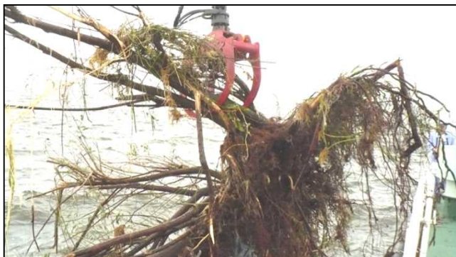
清掃兼油回収船「べいくりん」による浮遊ゴミの回収作業