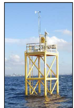
設置されたモニタリングポスト(検見川沖)