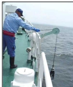
湾内6箇所にて水質調査を実施