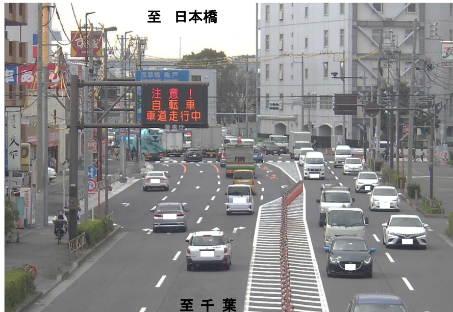
ひがしこまつがわ 東小松川交差点付近