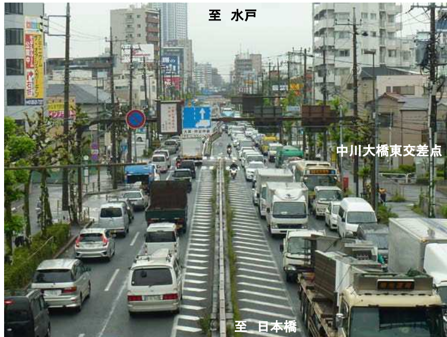
なかがわ 中川大橋東交差点付近