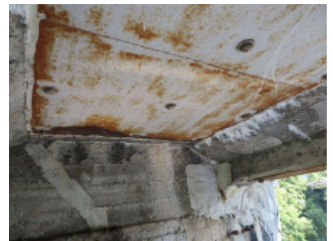
図-2 補強鋼板の腐食と遊離石灰