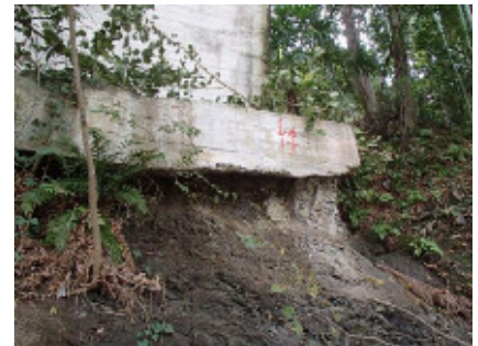
図-7 P4 アーチアバットの付近の浸食