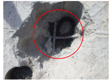
図-4 床版の滞水調査

直轄診断の結果から、管理する秩父市の要望もあり国による修繕代行業業として令和2年度に事業化された。これからも地方公共団体が抱える課題に対し、道路メンテナンス会議を通じて、道路インフラの維持管理についての情報共有や課題解決への連携を深め、地方公共団体の技術的支援に取り組んで参りたい。