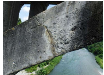
図-6 アーチリブのコールドジョイント