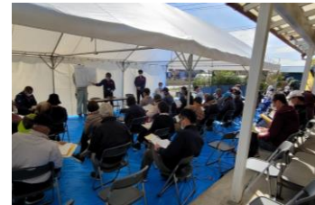
堅磐町 説明時の様子▶

大規模な堤防整備を行う常陸太田市堅磐地区では、堅磐町・上土木内町共同墓地使用者の皆様へ、新型コロナウイルス感染拡大防止対策に配慮しながら、墓地移転に関する説明会を開催しました。約100名の皆様にご参加いただき、現在の墓地に関する調査結果や新たな墓地移転候補地の状況、墓地移転に向けた進め方について、常陸太田市役所と合同で説明を行いました。