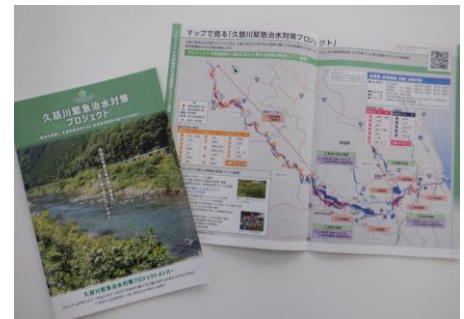
▲久慈川緊急治水対策パンフレット

(久慈川緊急治水対策プロジェクトパンフレット： https://www.ktr.mlit.go.jp/ktr_content/content/000828033.pdf )