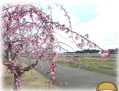
木曾川堤（サクラ）のエドヒガンと水府橋