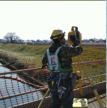
既製杭 杭芯ICT測量中 (杭ナビ)