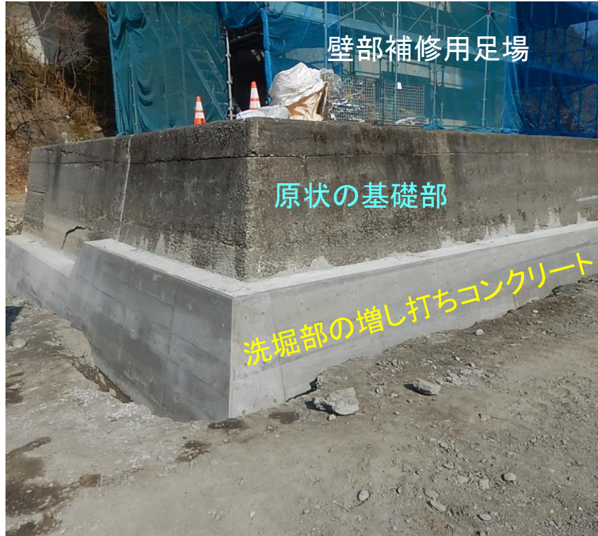
橋脚基礎部の補修状況

下部工の補修状況について、お知らせします。 橋脚基礎部では、洗堀箇所をコンクリートで補修しました。 橋脚柱(壁)部では、ひび割れや欠損部などの補修を行っています。