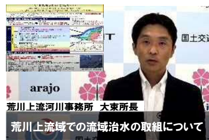
荒川上流河川事務所 大東所長 荒川上流域での流域治水の取組について