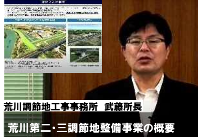
荒川調節地工事事務所 武蔵所長 荒川第二・三調節地整備事業の概要