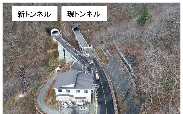
群馬県側抗口付近（R3.11）