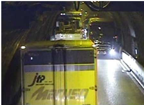
大型車のすれ違い状況