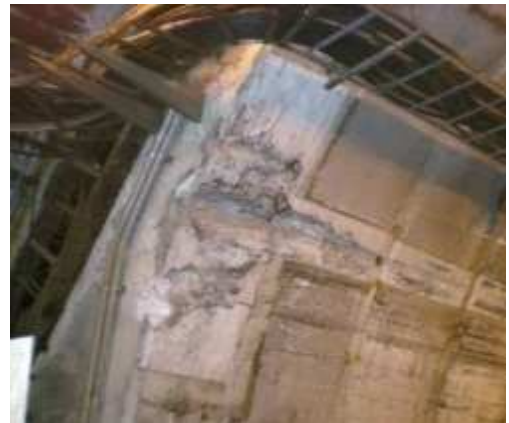
大型車による覆工の擦り状況