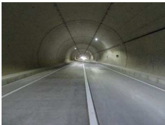
新三国トンネル内（R3.12）