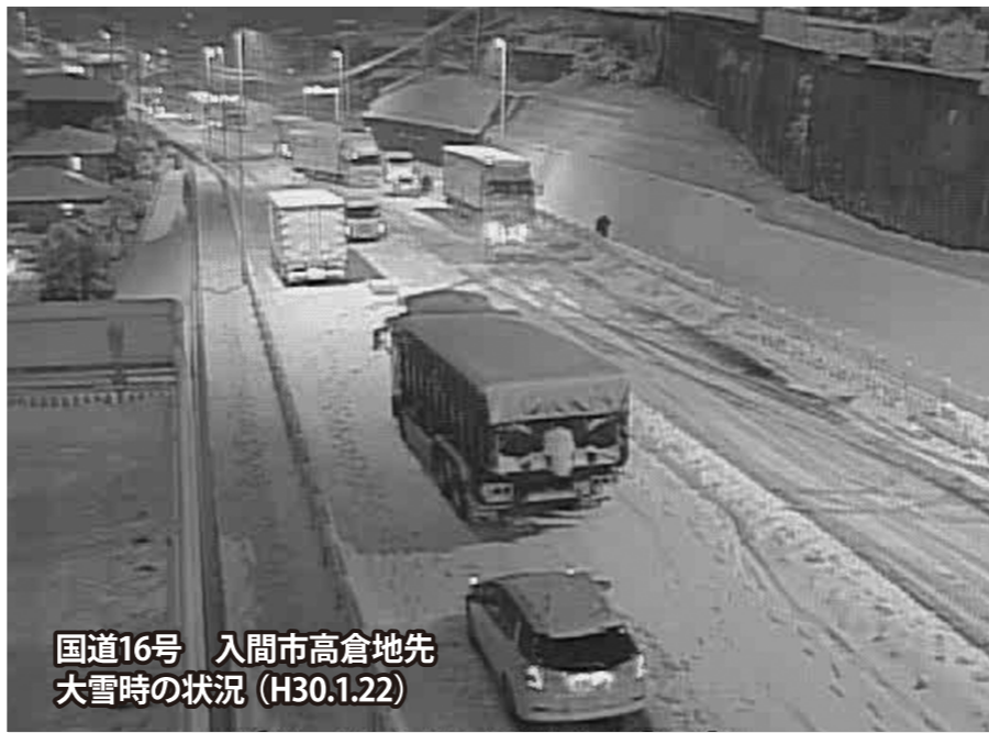
国道16号 入間市高倉地先 大雪時の状況 (H30.1.22)