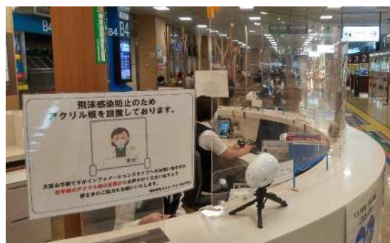
アクリルパネルの設置(インフォメーション)