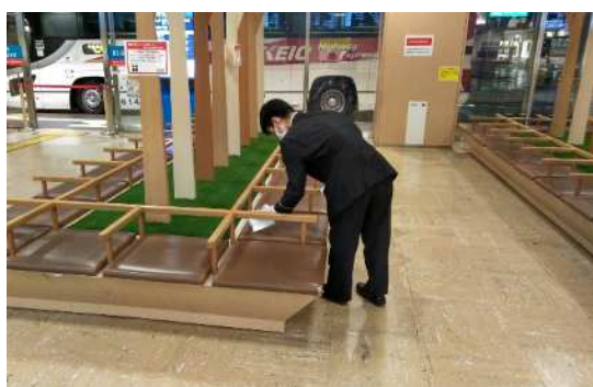
待合室ベンチの消毒