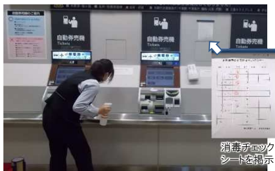
自動発券機の消毒