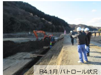
R4.1月 パトロール状況