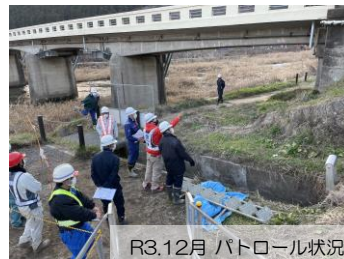
R3.12月 パトロール状況

全ての工事現場で事故が無く、安全に工事が完成できるように毎月1回、工事現場に潜む危険箇所や第三者への安全対策について、工事の現場代理人と事務所職員が合同で安全パトロールを行っています。