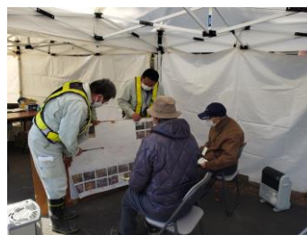
▲山方地区 (常陸大宮市)

堤防整備・河道掘削等で必要となる土地の取得面積等を確定するため、常陸大宮市山方地区で11名、那珂市額田地区で47名の地権者の方にお越しいただき、土地の境界を確認していただきました。