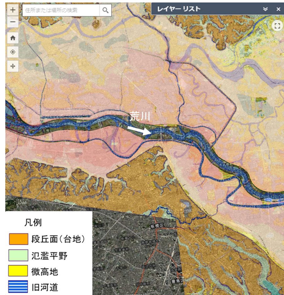
治水地形分類図に洪水浸水想定区域図(ピンク色)を重ねて表示すると「台地」は浸水しないことがわかります。)