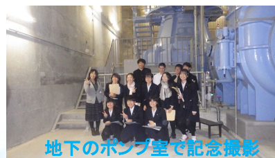
地下のポンプ室で記念撮影