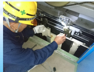
ゲートスイッチ点検中