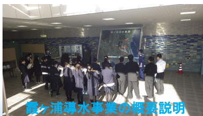
霞ヶ浦導水事業の概要説明