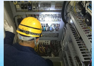
コントローラー点検中