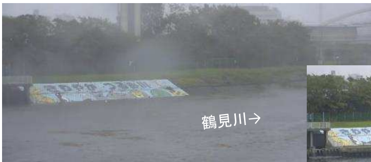
工事箇所付近における 令和元年東日本台風の状況