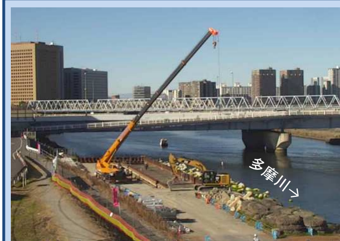
護岸を施工しています。 (令和4年12月)