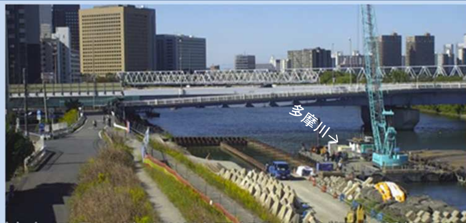
護岸を施工しています。 (令和4年10月)