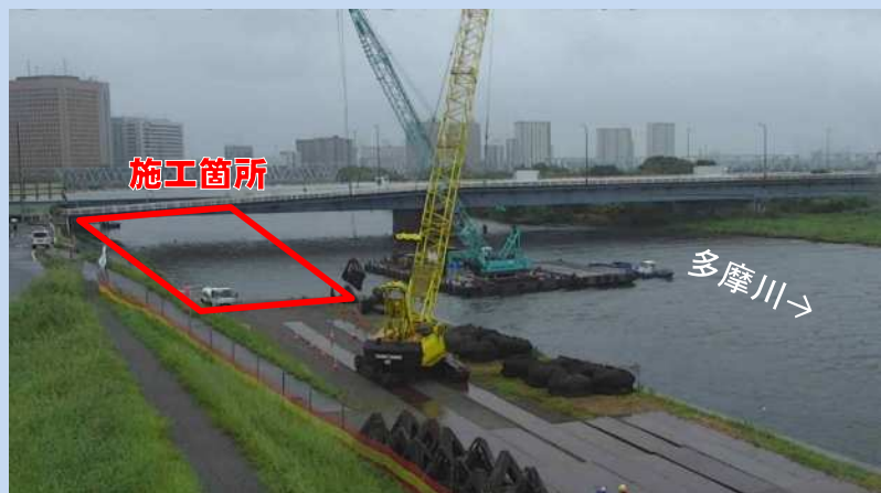
護岸を施工するための準備をしています。 (令和4年8月)