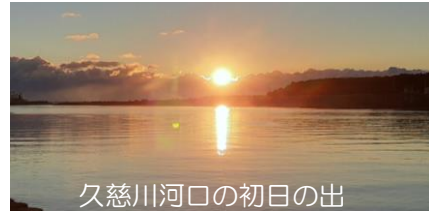
久慈川河口の初日の出

○新年あけましておめでとうございます。 ○令和2年1月から開始したプロジェクトは、地域の皆様への事業内容の説明を進め、用地取得に向けた交渉や工事を進めています。引き続きご協力をお願いいたします。