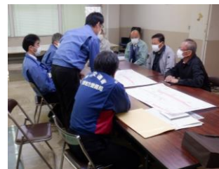
久野瀬地区 (大子町)

設計内容や用地測量等に関する説明を12月2日に大子町久野瀬地区、12月16日に下津原地区の区長様に行うとともに、地域の皆様には回覧により周知いたしました。