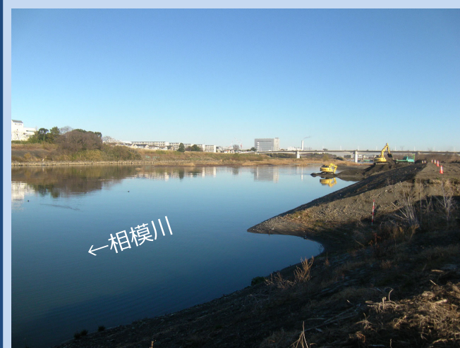
河道を掘削しています。 (令和3年12月)