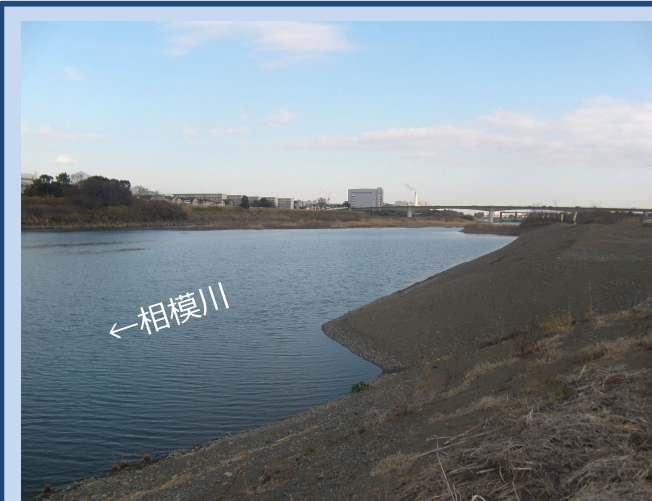
河道掘削が完了しました。現在は掘削土の搬出をしています。(令和4年1月)