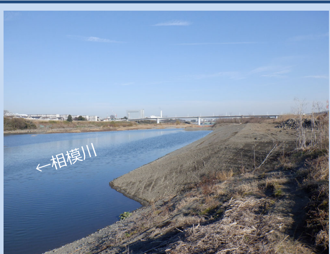
完成了しました。(令和4年2月)