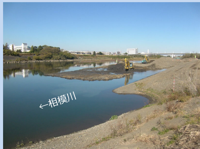
河道を掘削しています。 (令和3年11月)