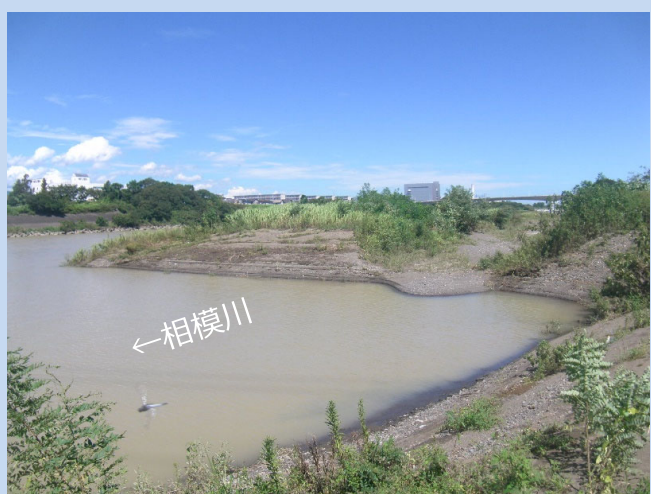
工事着手前(令和3年8月)