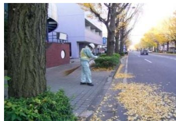
昼間時の清掃作業