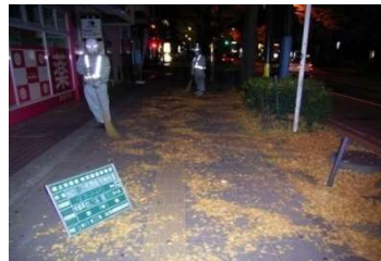
夜間時の清掃作業