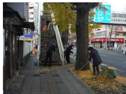
昨年度の実施状況

【取材】 当日は、自由に取材ができます。 取材を希望される場合は、相武国道事務所まで事前にご連絡をお願い致します。 なお、新型コロナウイルス感染拡大防止のため、参加者はマスク着用等を徹底することとしておりますので、取材をされる方も同様の対応をお願い致します。