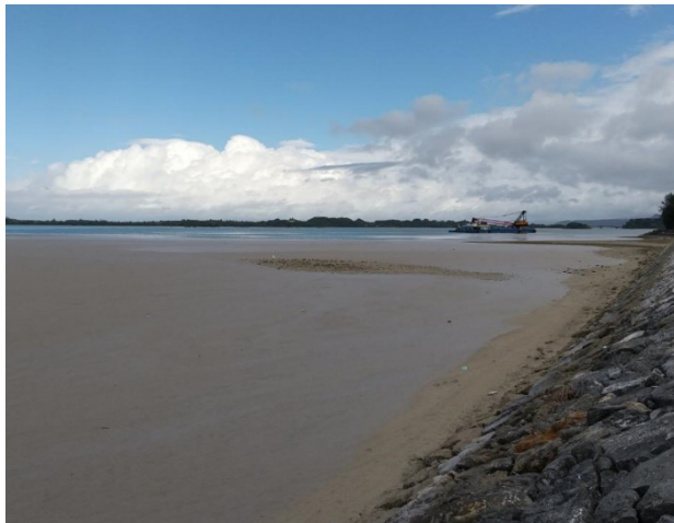
活動状況(目視による漂着状況調査)