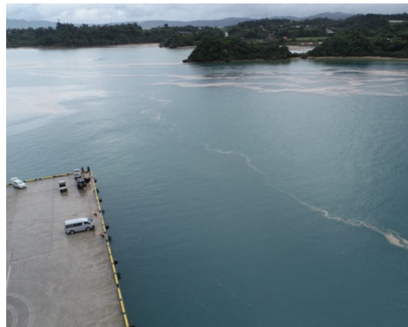
活動状況(ドローン撮影画像)