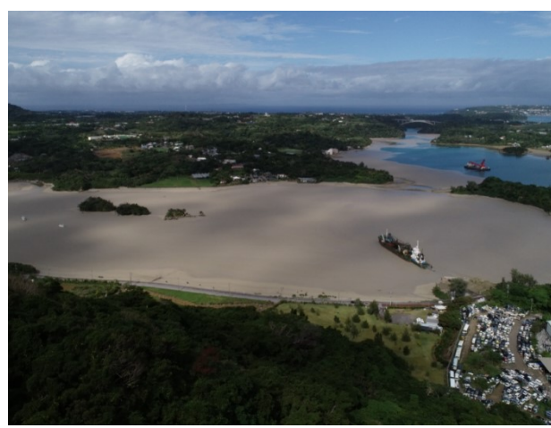
活動状況(ドローン撮影画像)