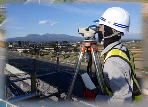
測量による高さ管理

出かけることが好きなので、休日や長期の休みが取れた時は、遠くへ旅行へ行ったりしています。上の写真は、友達と沖縄へ行った時のものです。一人旅も好きでよく行きます。