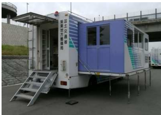
対策本部車 (拡幅式)