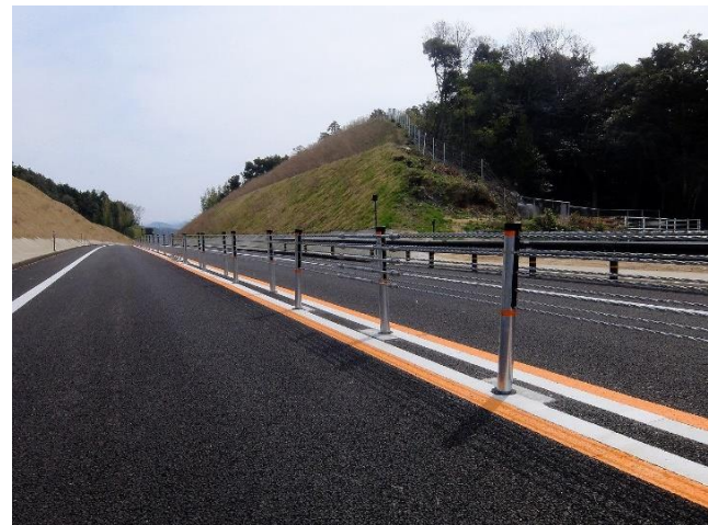
ワイヤーロープ設置イメージ(中間部)