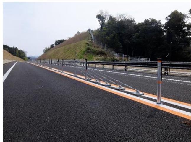
ワイヤーロープ設置イメージ(端部)